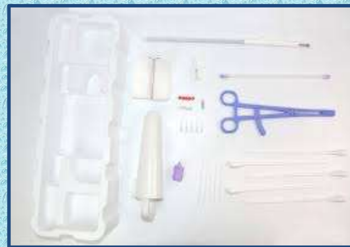
Figure 2 : kit de prélèvement à usage unique