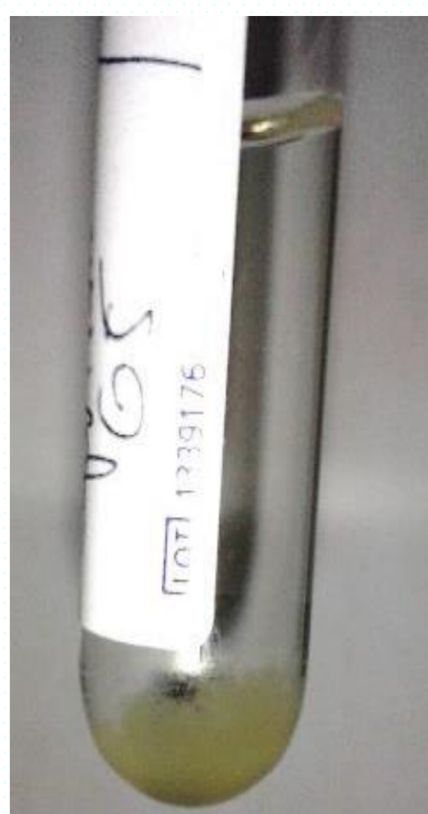
Précipitation du Céfotaxime avec l'Amphotéricine B au bout de 30min

A l'issue de ces tests, le Céfotaxime est physiquement incompatible avec 2 des solutions médicamenteuses testées (5%) l'Amphotéricine B et de l'Oméprazole.