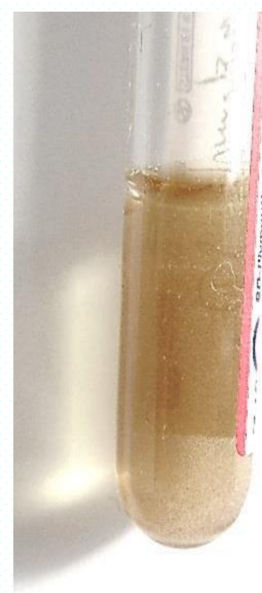
Précipitation du Céfotaxime avec l'oméprazole au bout de 4h

Aucune différence significative n'a été observée entre les deux solutions de céfotaxime utilisées (dilués dans le NaCl 0,9% et G5%).